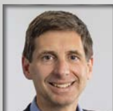
VI. BPA Dachau

Täglich setzen wir uns bei politisch Verantwortlichen für optimale Arbeitsbedingungen, berufliches Fortkommen und allgemeine Berufszufriedenheit ein. Durch gezielte Öffentlichkeitsarbeit leisten wir einen konkreten Beitrag, das Bild der Polizei nachhaltig positiv darzustellen.