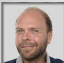
V. BPA Königsbrunn

Ihr wurdet zum 1. September 2023 in den Standorten der Bereitschaftspolizei Eichstätt, Würzburg, Königsbrunn, Dachau und Sulzbach-Rosenberg eingestellt. Die GdP heißt Euch als große und starke Solidargemeinschaft willkommen.