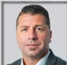
II. BPA Eichstätt