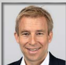
III. BPA Würzburg

wir freuen uns, Euch als neue Angehörige der Bayerischen Polizei begrüßen zu dürfen!