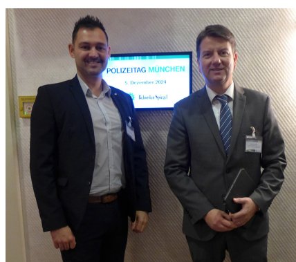
GdP-Landesvorsitzender Florian Leitner und Innenstaatssekretär Sandro Kirchner

hob das breite Spektrum der Herausforderungen hervor, denen die Polizei in ihren drei Aufgabenbereichen Bevölkerungsschutz, Terrorismusbekämpfung und Kriminalitätsbekämpfung gegenübersteht. In Bayern stehe man im bundesweiten Vergleich mit einer fulminant hohen Aufklärungsquote und stetig hohen Einstellungszahlen bei der Polizei hervorragend da.