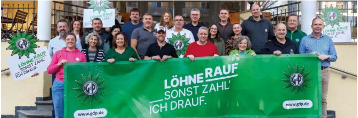
Gemeinsam stark – für gerechte Arbeitsbedingungen bei der Polizei!